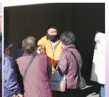
来場者にそばなどのサービス