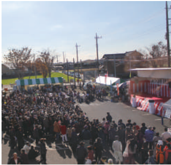
ステージは大観衆