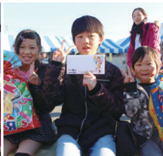
ビンゴ大会おめでとうございます