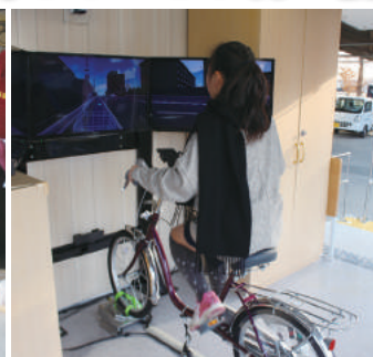
自転車シミュレーターでマナーアップ