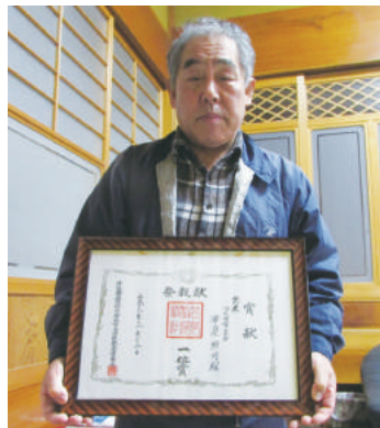
献米祭 玄米の部 一位賞