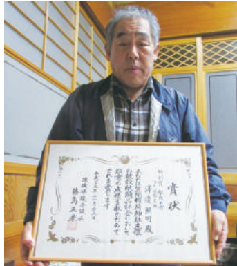
献米献薬品評会 特別賞