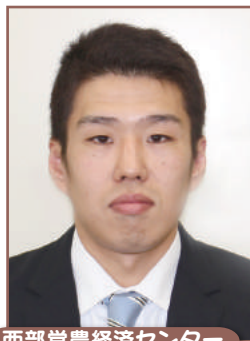
西部営農経済センター