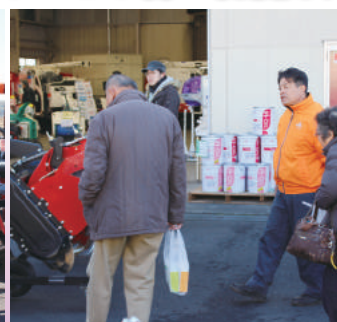
職員が詳しく説明します