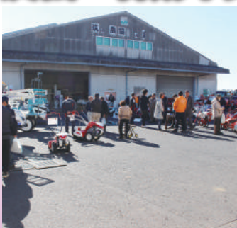
たくさんの来場者が展示を見学