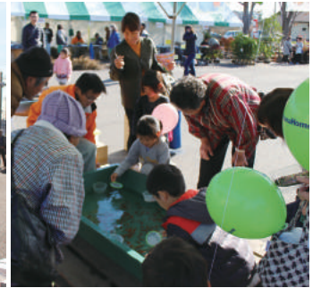
来場者サービスの金魚すくい