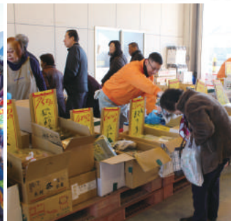
賑わうヤマサ水産ブース