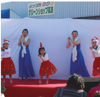
フラステージショー