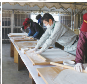
次々と手打ちそばを作ります