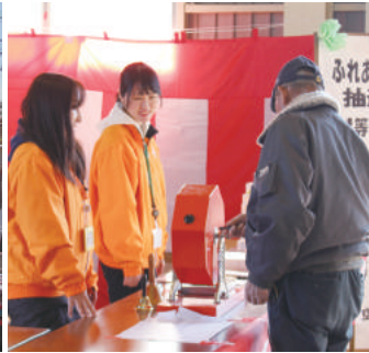
豪華賞品がいっぱいの抽選ブース