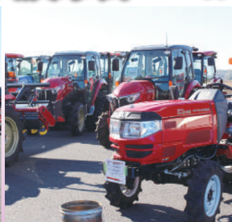
各メーカーの農機具が並びます