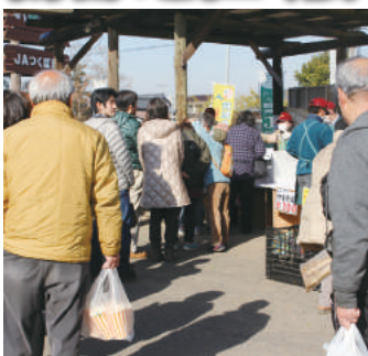
行列ができる部会員の焼きそば