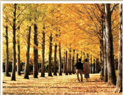
撮影場所 つくば市 万博記念公園・11月中旬