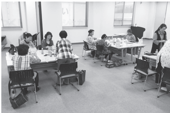
和気あいあいと作業中

JAつくば市女性部では、随時部員を募集しております。少しでも気になった方は、お気軽にお問い合わせ下さい。